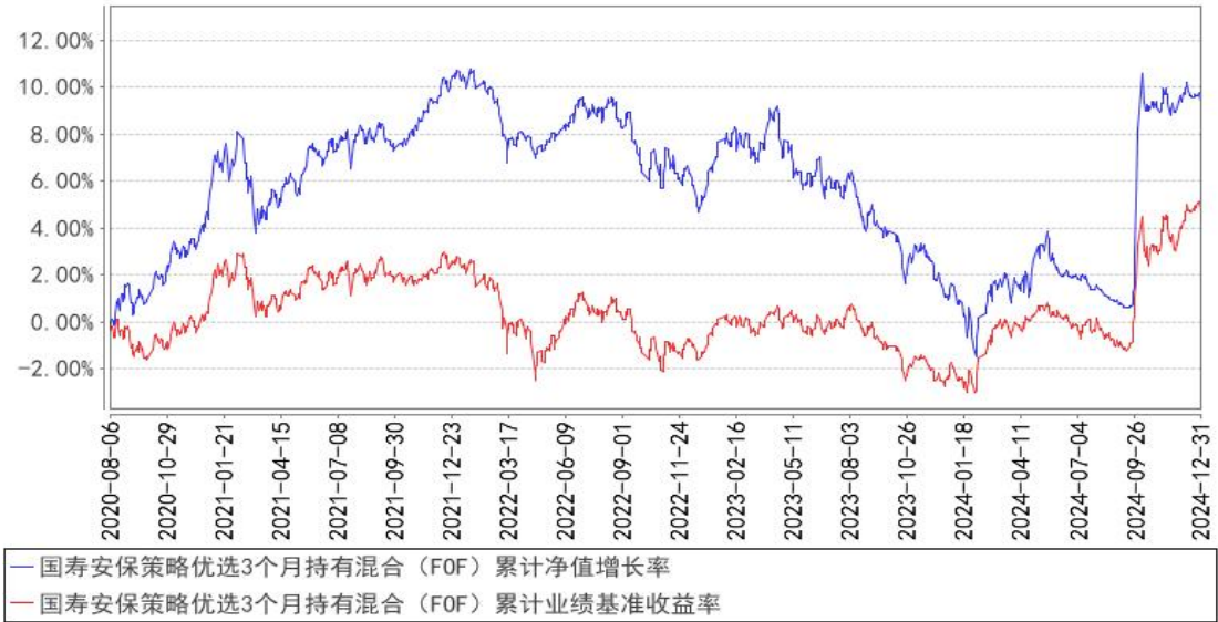
国寿安保策略优选3个月持有混合（FOF）累计净值增长率与同期业绩比较基准收 益率的历史走势对比图

注：本基金基金合同生效日为 2020 年 08 月 06 日，按照本基金的基金合同规定, 自基金合同生效之日起 6 个月内使基金的投资组合比例符合基金合同关于投资范围和投资限制的有关约定。本基金建仓期结束时各项资产配置比例符合基金合同约定。图示日期为 2020 年 08 月 06 日至 2024 年 12 月 31 日。